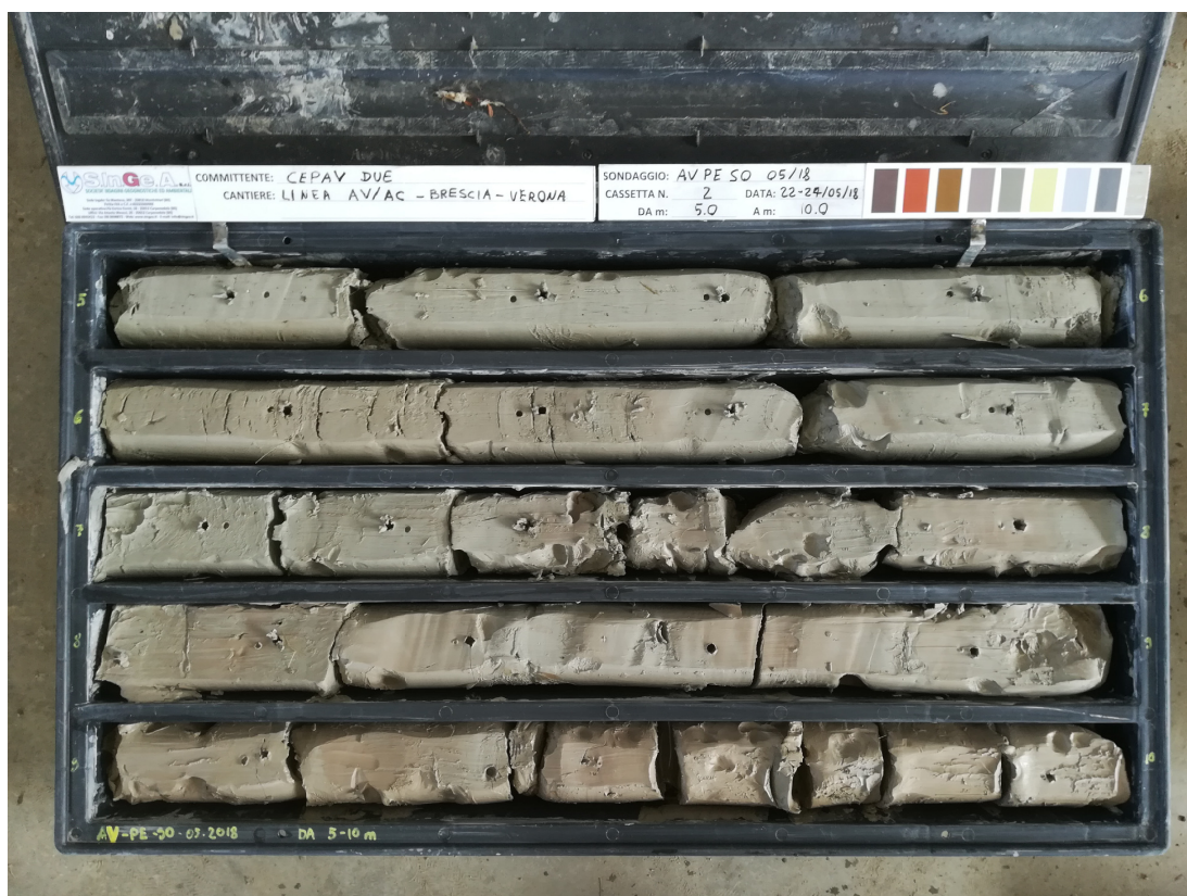
SONDAGGIO AV-PE-SO-05/18 – Cassa n.2 da 5.00 m a 10.00 m