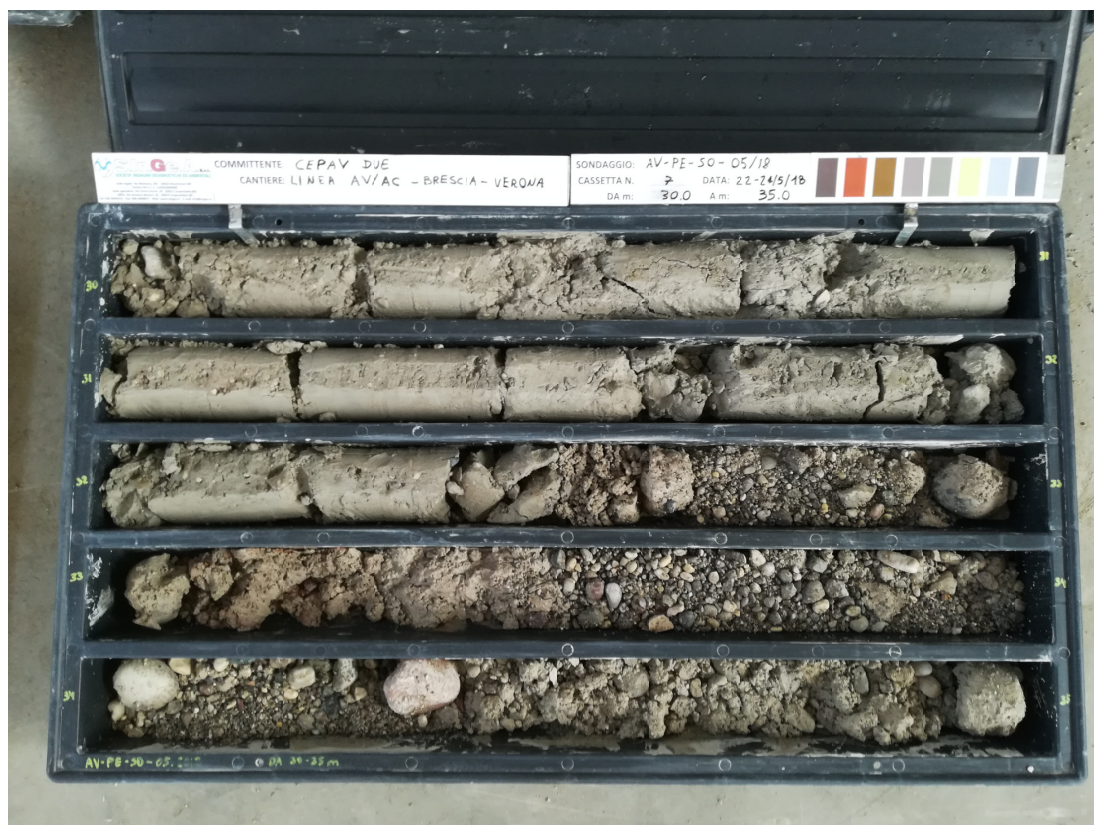
SONDAGGIO AV-PE-SO-05/18 – Cassa n.7 da 30.00 m a 35.00 m