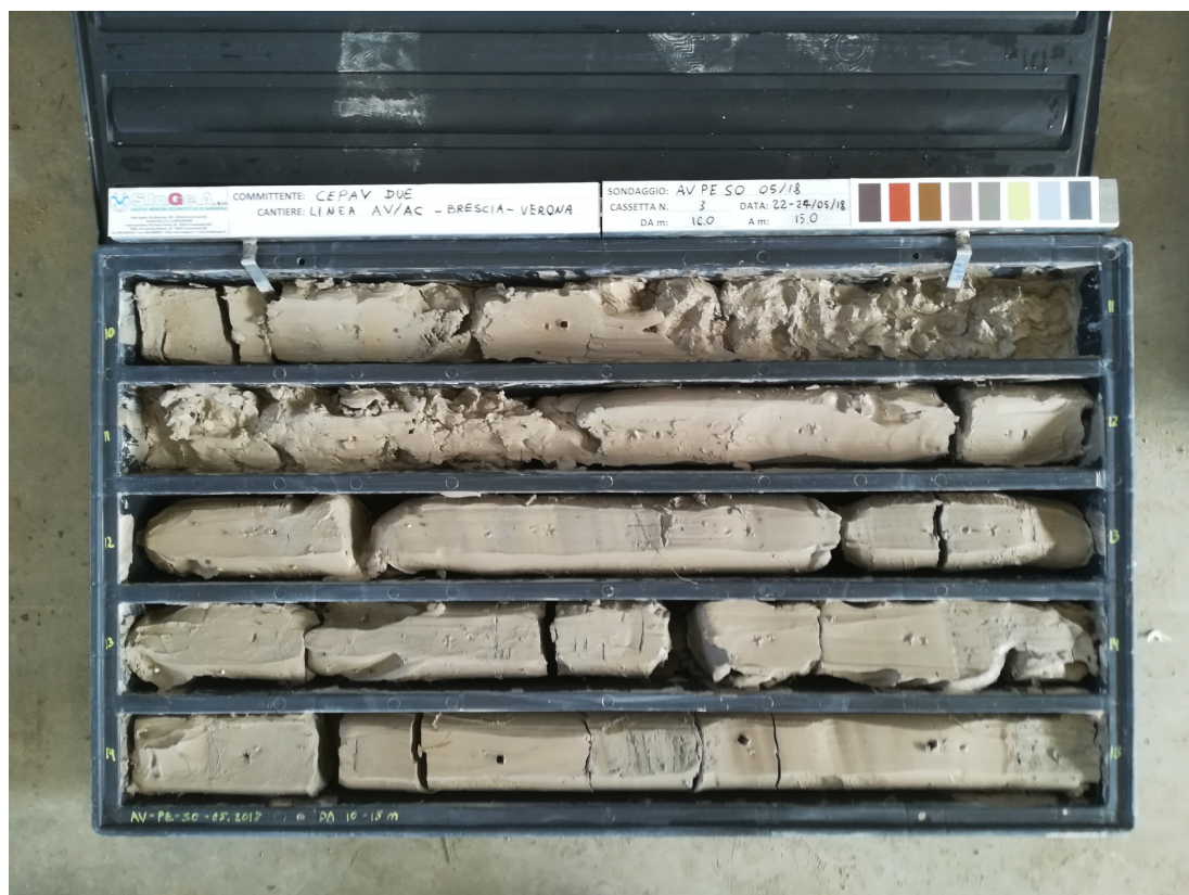
SONDAGGIO AV-PE-SO-05/18 – Cassa n.3 da 10.00 m a 15.00 m