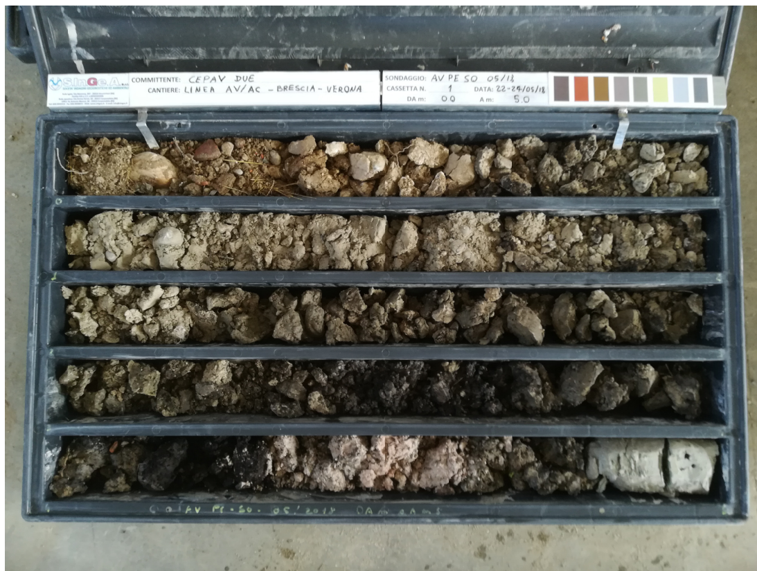
SONDAGGIO AV-PE-SO-05/18 – Cassa n.1 da 0.00 m a 5.00 m