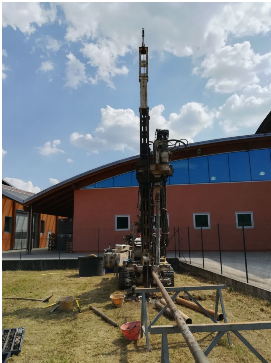
SONDAGGIO AV-PE-SO-05/18 – Postazione