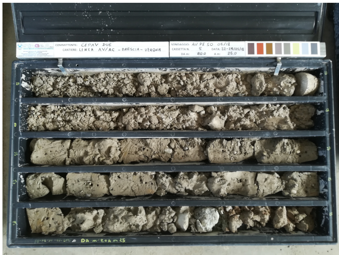
SONDAGGIO AV-PE-SO-05/18 – Cassa n.5 da 20.00 m a 25.00 m